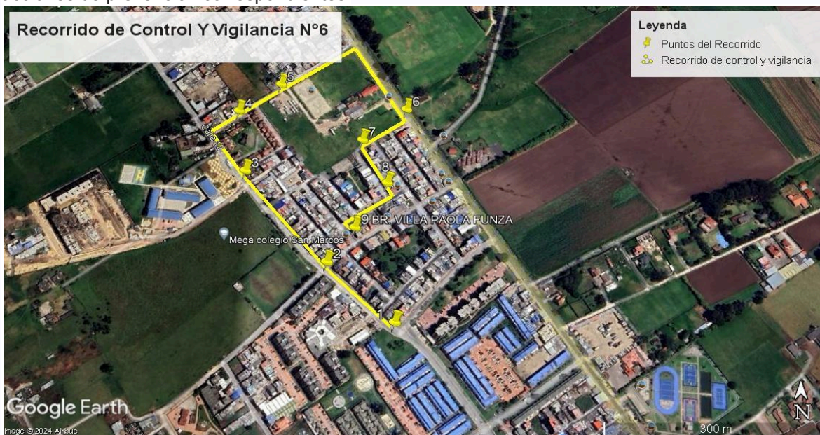
Ilustración 1. Recorrido de Control Y Vigilancia N°5

Se realizó recorrido de control y vigilancia en el cuadrante 3, barrio Villa Paola el día 22 de abril del 2024, desde las coordenadas 4°43'27.174"N- 74°13'4.842" W hasta las coordenadas 4°43'31,908" N- 74°13'6.774 'W (ver ilustración 1. Ruta amarilla), con el fin de verificar las condiciones ambientales, identificar posibles afectaciones a los recursos naturales y realizar las acciones de prevención correspondientes.