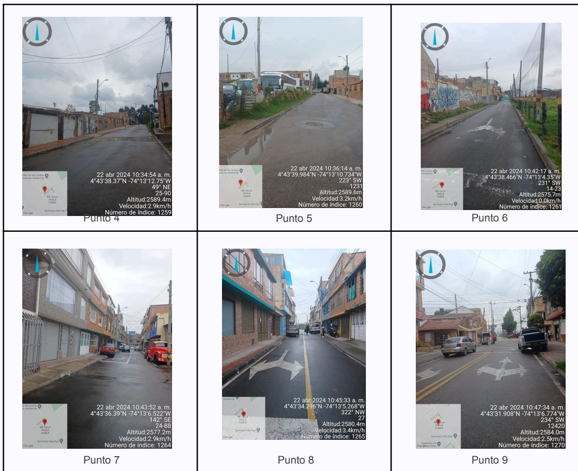
Ilustración 2. Fotos de los puntos del Recorrido de Control Y Vigilancia.